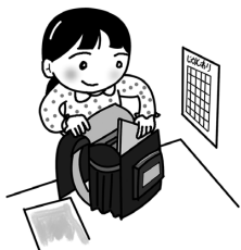
じかんわりをあわせる