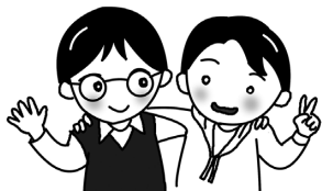
あたらしいともだち