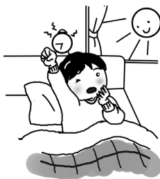
ねぼうせずにおきる