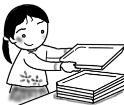
とうばん・かかりの おしごと